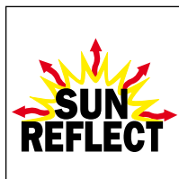
Sun Reflect Leder