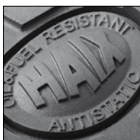
Neu entwickelte Sohle